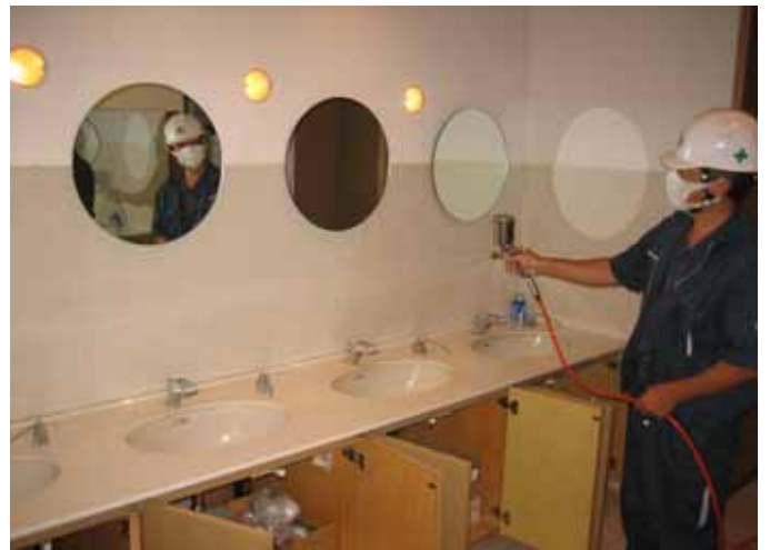
銀系光触媒イーデンフラッシュ EDF による施工（男子・女子トイレ）