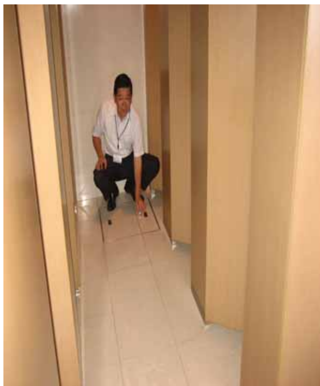
1 回目の細菌（一般細菌）採取模様：男子・女子トイレ（床）