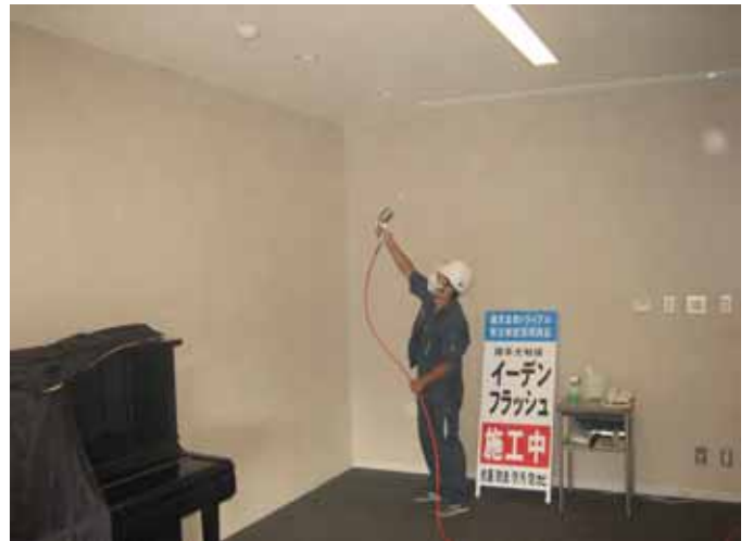
銀系光触媒イーデンフラッシュ EDF による施工模様（練習室 ・床・壁・天井）