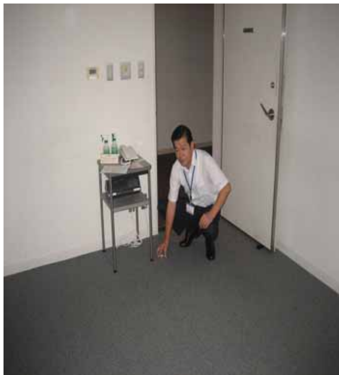
1 回目の細菌（一般細菌）採取模様：練習室